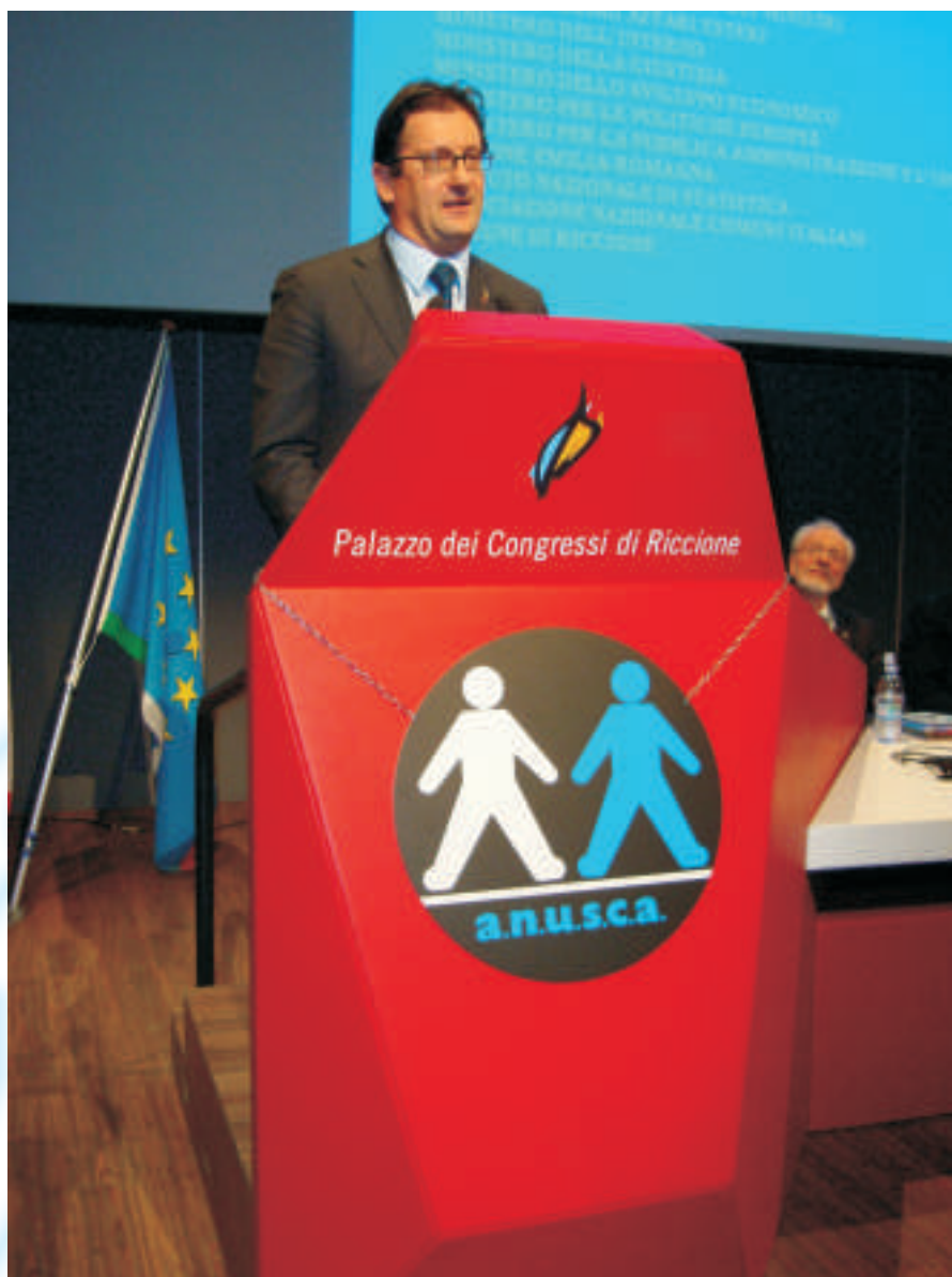
Il sottosegretario sen. Michelino Davico interviene all'apertura del convegno nazionale ANUSCA dello scorso anno. Il sottosegretario agli interni con delega ai servizi demografici è figura nota e gradita agli operatori che confidano di avere anche quest'anno.

In sostanza, una "tribuna" volta a costruire, più che a distruggere, come ha fatto il Presidente dell'ANUSCA, Paride Gullini allorché