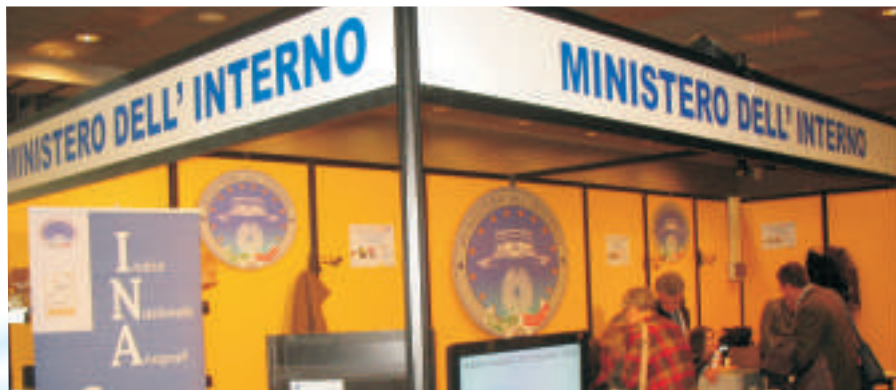
Lo stand del Ministero dell’Interno al convegno nazionale ANUSCA di Riccione 2008

strumento offerto da ANUSCA per veicolare la comunicazione istituzionale e quella di servizio. Il Comune Informa – Città in TV è una tecnologia realizzata insieme a Postecom e Semplicità attraverso la quale il Comune potrà diffondere informazioni ai propri cittadini con l’ausilio specifici video collegati ad Internet.