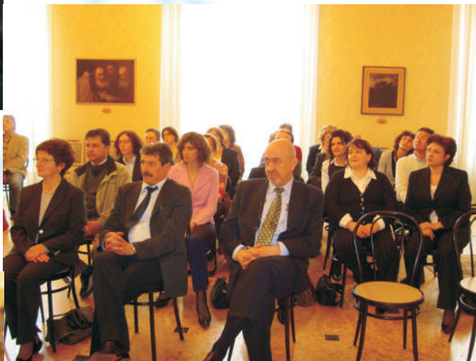
La platea dei "premiandi" segue le dichiarazioni delle Autorità con evidente interesse.