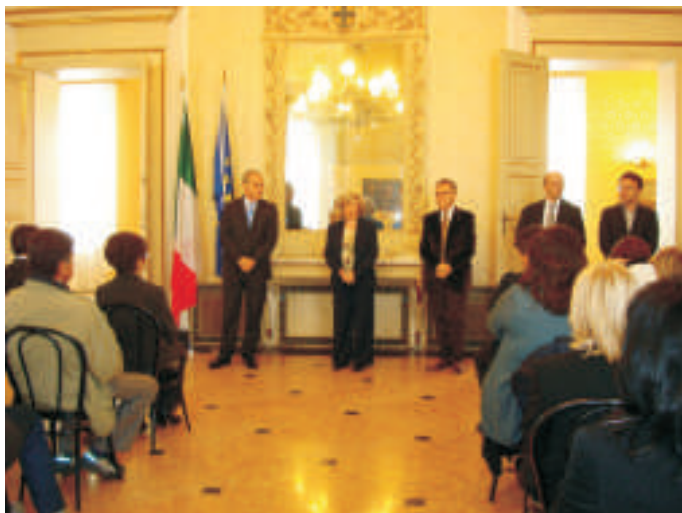
L'apertura della cerimonia di premiazione di Modena con le autorità preposte alla consegna dei diplomi.