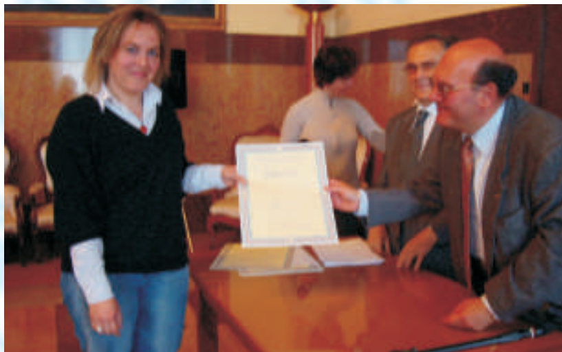
Consegna dell'attestato di Ufficiale di Stato Civile