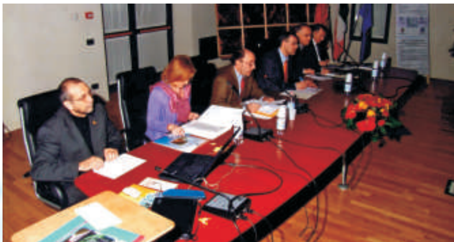
Il seminario di studio di Este è giunto al diciottesimo anno di successi. Complimenti!

Due giornate che hanno ricevuto il massimo apprezzamento dei partecipanti, sempre attenti e partecipi, come dimostrano i vivaci dibattiti scaturiti al termine di ogni relazione.