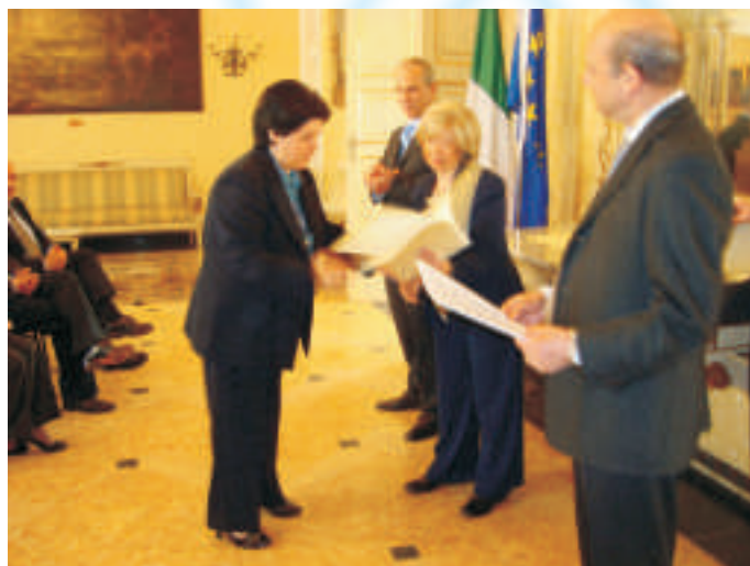
Gli allievi dei corsi di formazione ritirano gli attestati