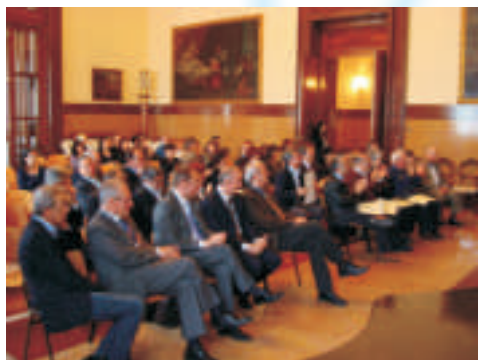
Sindaci e Assessori con i propri operatori demografici seguono con interesse la consegna degli Attestati

Alla cerimonia di Forlì hanno partecipato anche numerosi sindaci e assessori dei Comuni interessati.