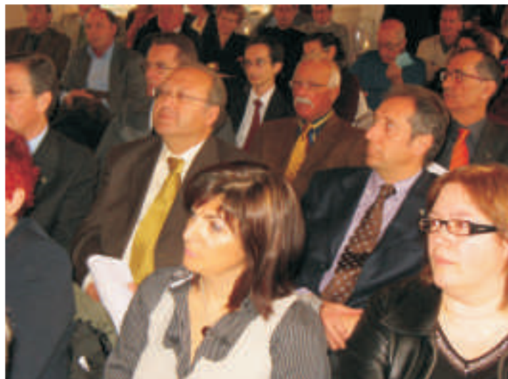
Sala plenaria affollata di soci ANUSCA.