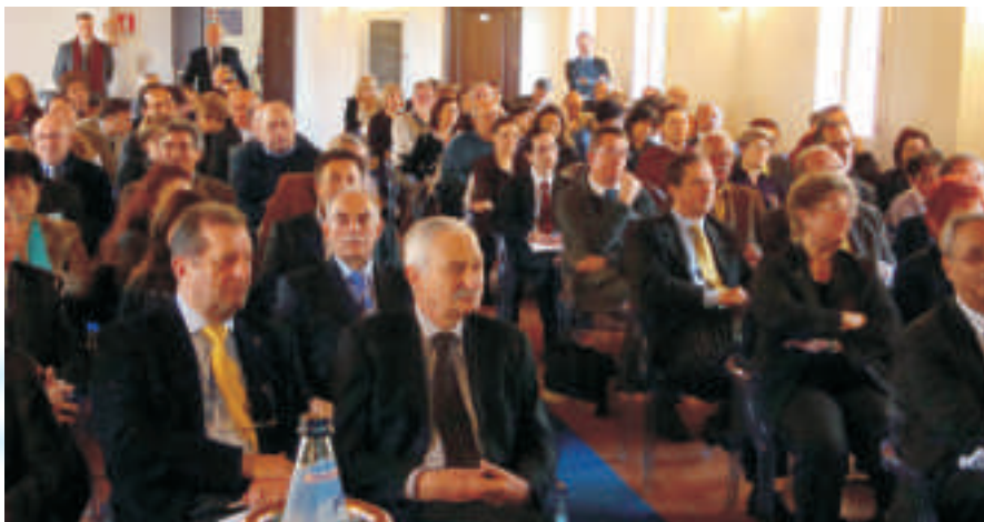
Parziale veduta dei partecipanti all'Assemblea dei Soci ANUSCA. Si procede a votazioni distinte: soci fondatori, soci sostenitori

In particolare, esprime pieno apprezzamento per quei colleghi che per assiduità, impegno e disponibilità hanno reso possibile il raggiungimento