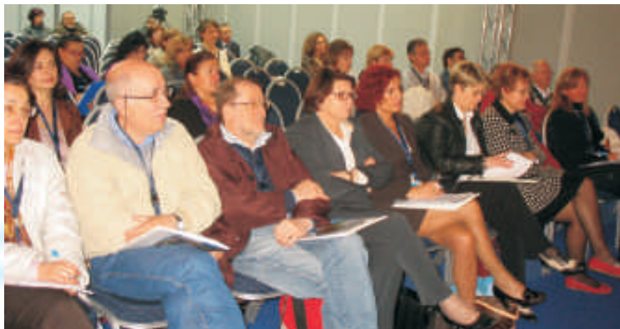
Una bella platea di operatori demografici vicini all'ANUSCA

In questa fase, considerato che la legge distingue il momento della presentazione della lista, inteso come attività di raccolta delle firme, dal momento della consegna materiale della stessa, risulta del tutto superflua l'autenticazione delle firme di coloro che depositano la documentazione presso gli uffici comunali, posto che l'autenticazione è