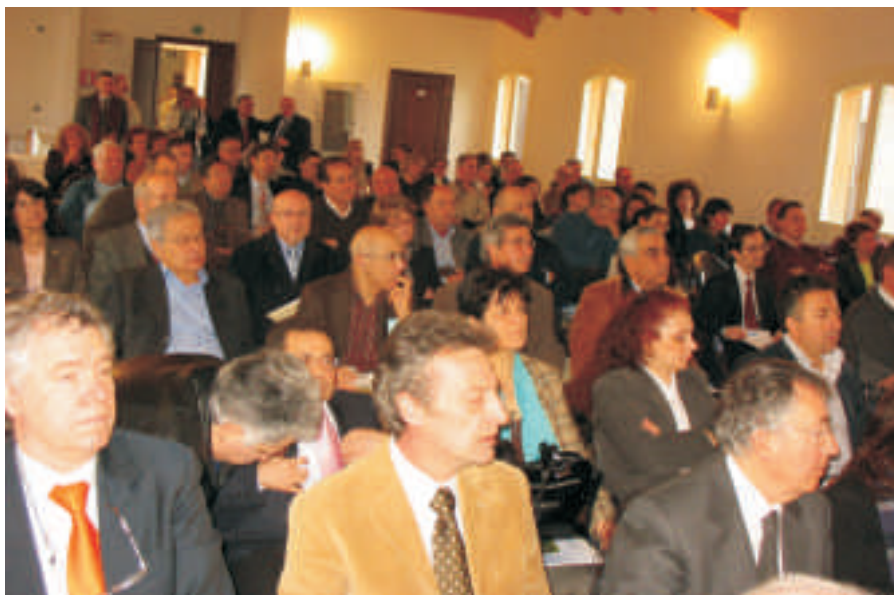
Scorcio dell'Assemblea ANUSCA in Accademia.

L'Associazione ringrazia sin d'ora le colleghe e i colleghi che vorranno approfittare del nostro canale per testimoniare la loro vicinanza a coloro che sono stati colpiti negli affetti più cari.