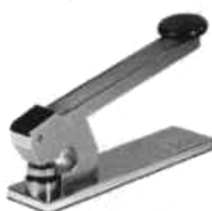
Mod. T.E.S. 101

Timbratrici a secco da tavolo elettriche e manuali