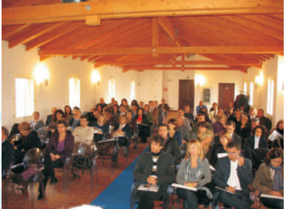
Operatori dell'ISTAT riuniti nella Sala dell'Accademia per il lavoro di preparazione del Censimento nazionale 2009-2011. La struttura di ANUSCA con annesso albergo, si è rivelata funzionale logisticamente per più incontri suddivisi per regioni.