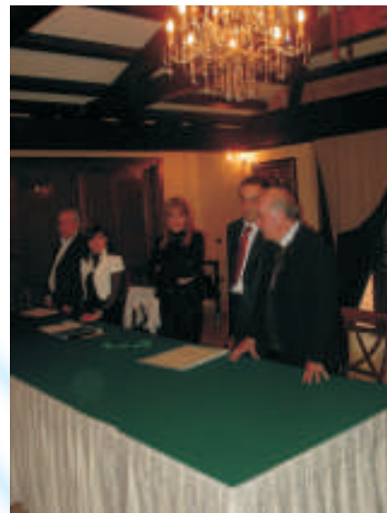
Il Vice Presidente Nazionale ANUSCA all'apertura dei lavori, al tavolo della presidenza con le autorità cittadine