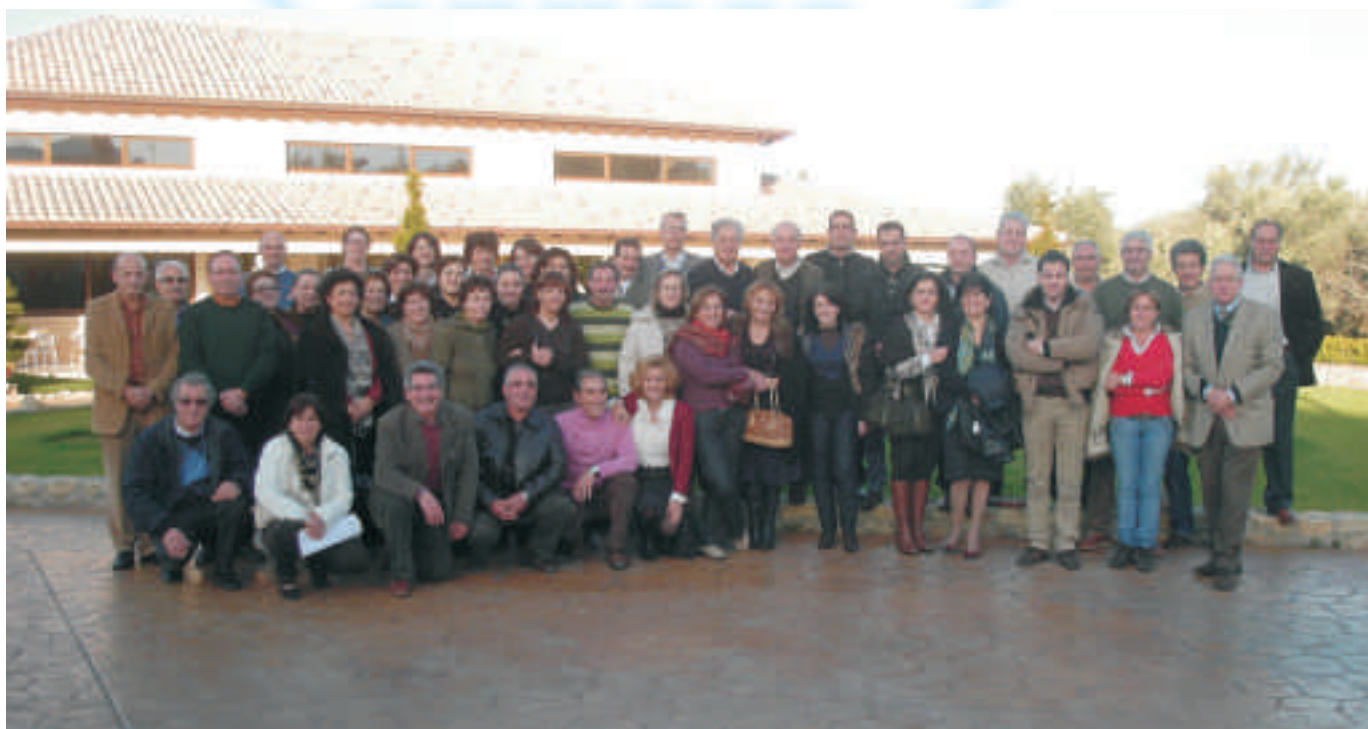
Foto di gruppo dei partecipanti al corso di abilitazione della provincia di Catanzaro.

Tutto sommato la valenza del corso è stata pienamente qualificante per le