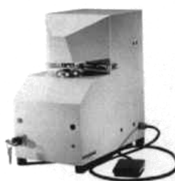
Mod. T.M.S. 202