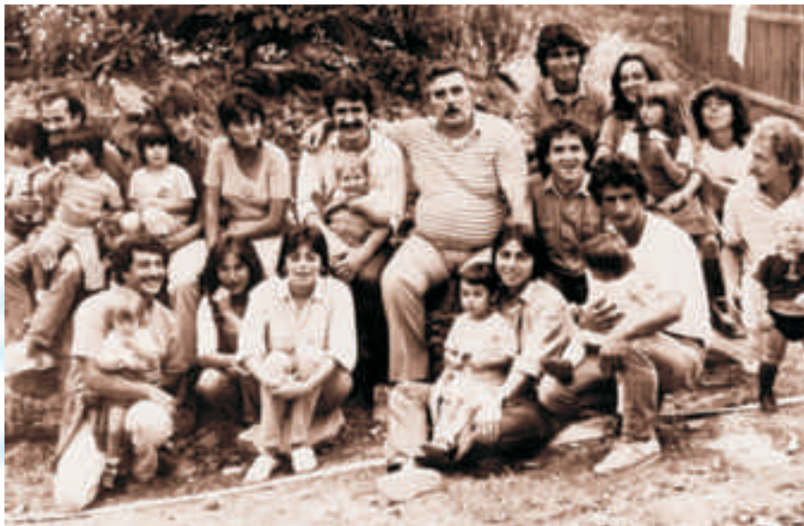
Foto storica con il fondatore della Comunità Vincenzo Muccioli