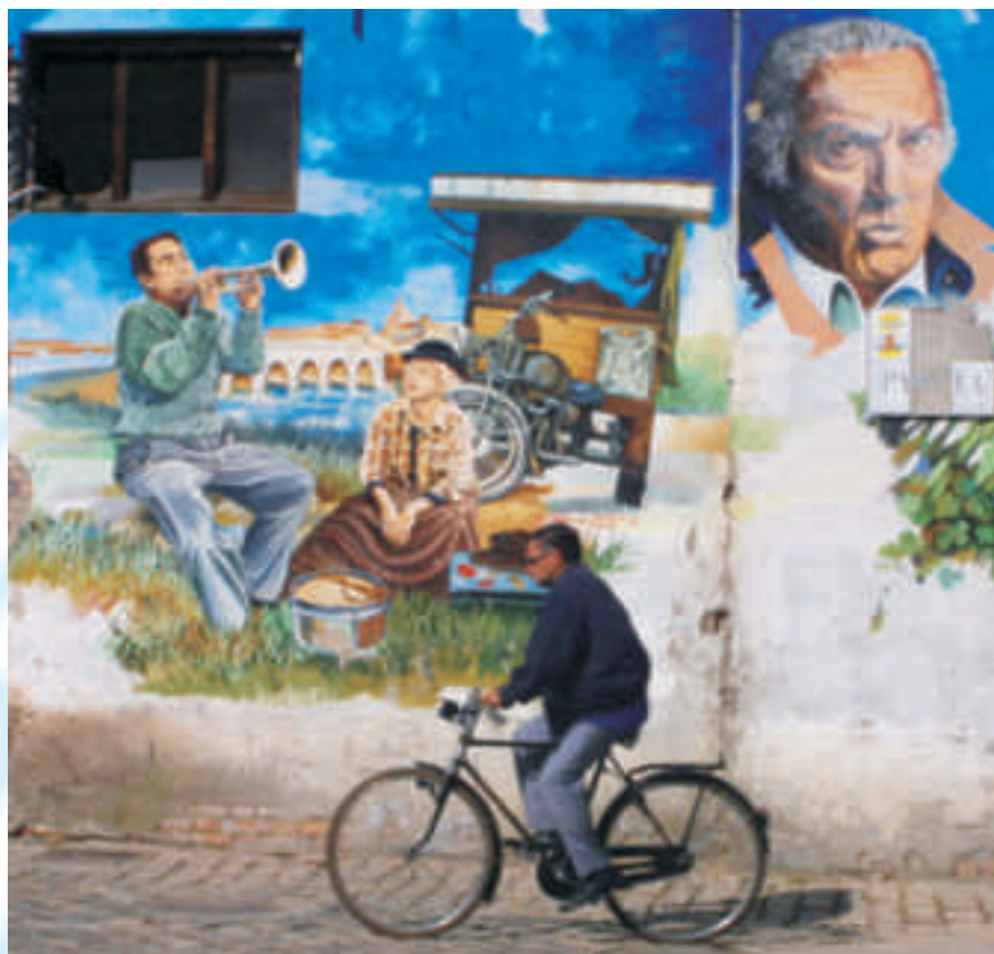
Un murales dedicato al Maestro Fellini