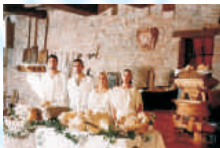
Mulino della Porta di Sotto

"Formaggio delle Fosse della Porta di Sotto", divenendo testimone di pregiate valenze agroalimentari e gastronomiche.