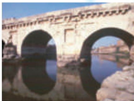
Il ponte di Tiberio

Partenza dall'Arco d'Augusto, proseguimento per centro storico attraverso il Corso, Piazza Tre Martiri, il Duomo o Tempio Malatestiano), Piazza Cavour con tutti i suoi monumenti compreso castelsismondo, Ponte di Tiberio e la prestigiosa recente scoperta della Domus del Chirurgo, così chiamata a causa del reperimento di più di centocinquanta strumenti chirurgici, mortai, bilance e contenitori per la preparazione e la conservazione di farmaci e da un vaso termico conformato a piede per applicazioni curative.