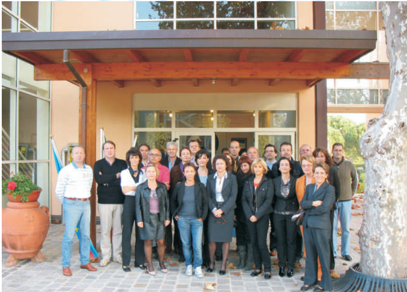
Foto di gruppo dei partecipanti al Corso di Alta formazione promosso dall'Accademia degli Ufficiali di Stato Civile

Nonostante si tratti di un impegno importante, 294 ore (da completarsi con 200 di stage per mettere in pratica le conoscenze acquisite in aula) che andranno spalmate su sette mesi in due moduli di due giorni e mezzo al mese, sono state oltre sessanta le domande pervenute alla segreteria del corso. Una chiara dimostrazione di come l'idea