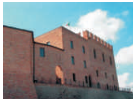
Una veduta della Rocca Malatestiana

Ricca di quasi 250.000 volumi, è un bene protetto dall'UNESCO in quanto considerato patrimonio dell'umanità.