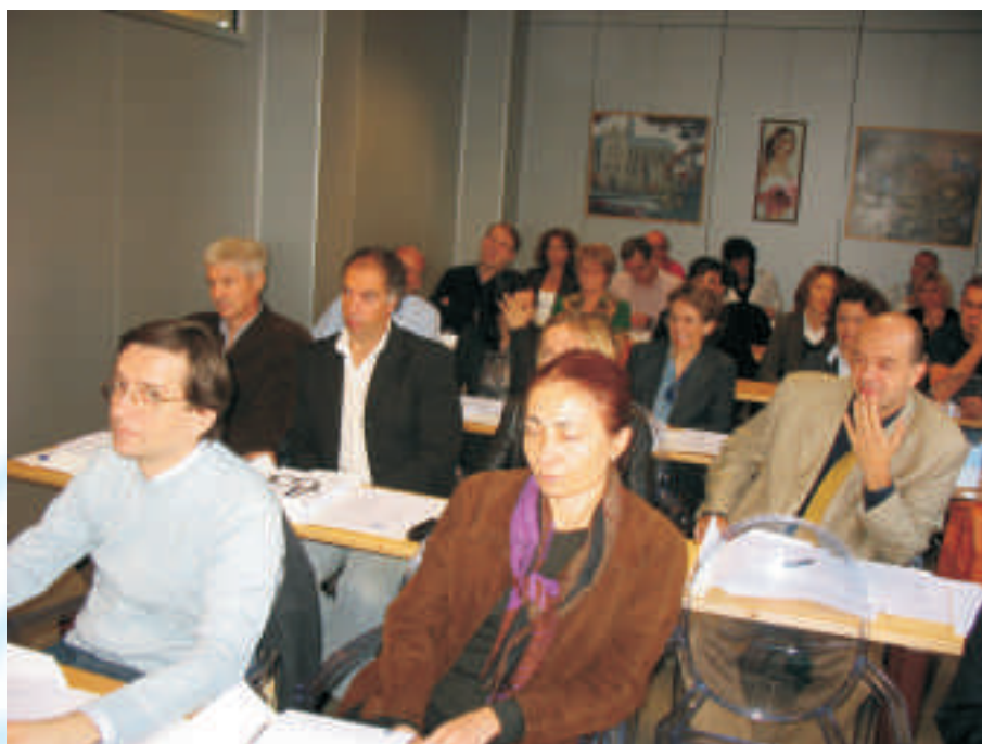
Un'immagine di una lezione del Corso di Alta Formazione

ma che i corsisti stanno sostenendo con grande brillantezza.