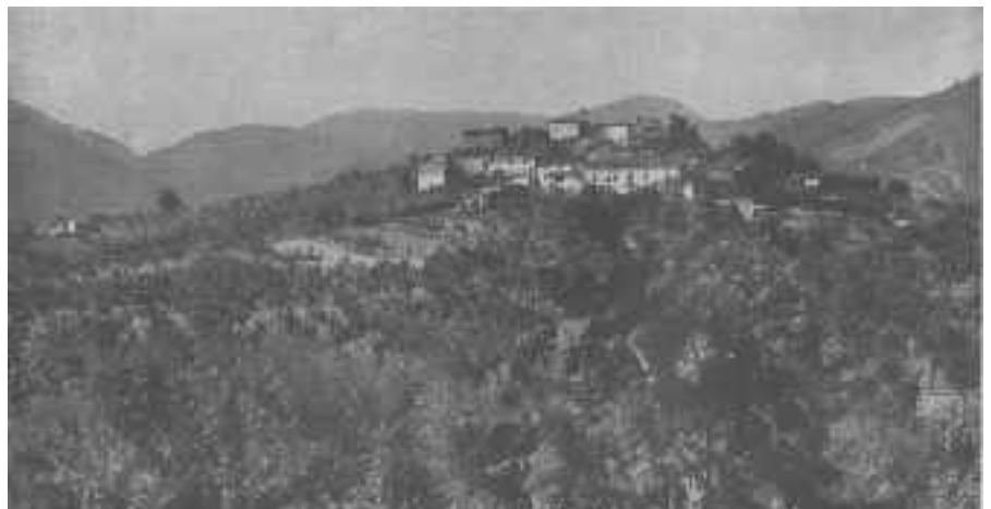
Una veduta panoramica dell'antica Repubblica di Cospaia