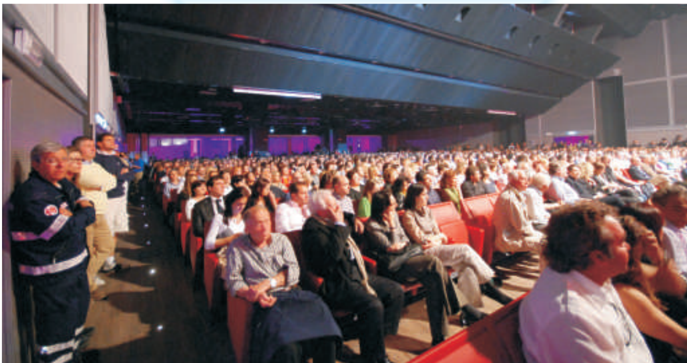
La Sala Plenaria del PalaCongressi della "Perla Verde" dell'Adriatico, struttura che, nelle accoglienti altre sale, ospiterà i numerosi workshop organizzati da ANUSCA a Riccione.

Info: www.anusca.it - Segreteria naz.le ANUSCA 051-944641