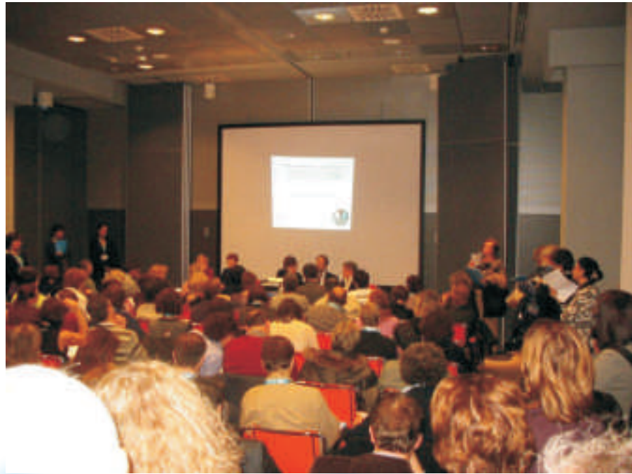
Una delle partecipatissime iniziative collaterali del 29° Convegno Nazionale di Riccione

Lavorare per il potenziamento della professionalità, puntando sull'innovazione e sulla continua riqualificazione è da sempre l'obiettivo di ANUSCA e siamo convinti che lo strumento operativo più idoneo per raggiungere questi obiettivi sia la Fondazione "Accademia degli ufficiali di stato civile, anagrafe ed elettorale" di Castel San Pietro Terme (unica in Italia e seconda esistente in Europa: l'altra è a