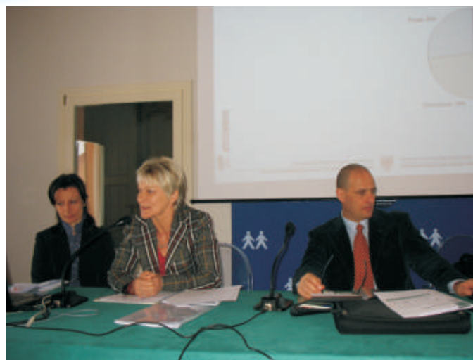
ISTAT: l'interessante seminario di studio seguito con interesse in tutte e tre le giornate