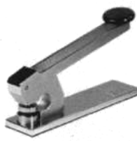
Mod. T.E.S. 101

Timbratrici a secco da tavolo elettriche e manuali