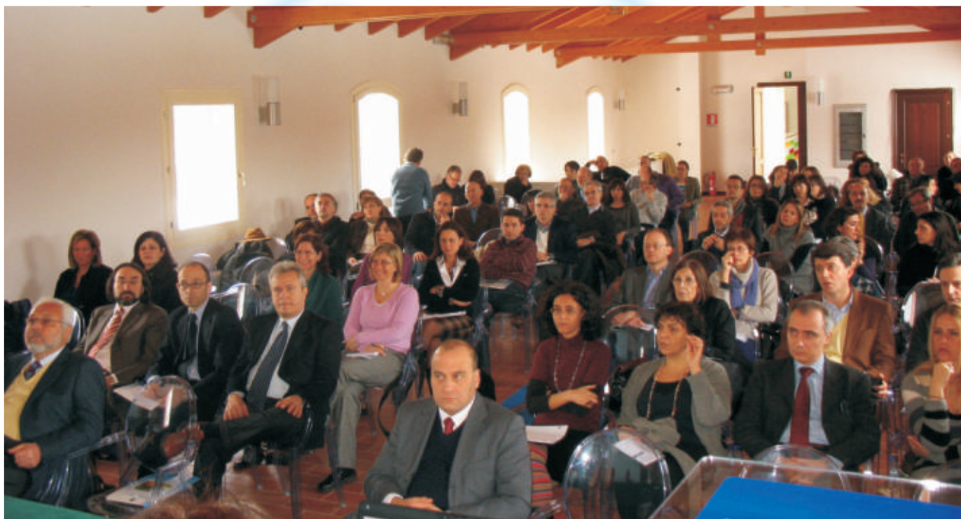
Ennesima riunione dell'ISTAT presso l'Accademia, in preparazione del 15° Censimento Generale della popolazione

Dal pomeriggio del 9 marzo e sino alla tarda mattinata dell'11 marzo, nell'accogliente Sala Plenaria dell'Accademia si sono alternati vari relatori, per illustrare i risultati della rilevazione, dalle elaborazioni sui questionari, ai quesiti posti dai rispondenti al numero verde; l'esperienza acquisita con la rilevazione pilota, la modalità di restituzione ed uso dei rilevatori, criticità e opportunità di organizzazione nelle valutazioni dei Comuni, quindi l'esempio dell'indagine pilota nella provincia di Bolzano, le proposte dalle sedi regionali dell'ISTAT, tutte argomentazioni che hanno poi stimolato la discussione in ognuna delle tre intense giornate di lavoro a Castel San Pietro Terme. Al Seminario ha partecipato il Direttore Centrale dei Censimenti Generali dell'ISTAT, Andrea Mancini.