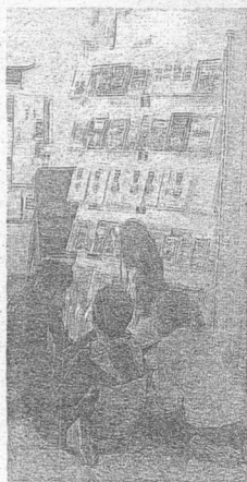
FRA I VOLUMI Un gruppo di baby utenti curiosa tra gli scaffali

Gay: «Abbiamo avviato contatti con università americane e avviato in altri posti opportunità di studio per lunghi periodi. In questo caso dovremo implementare le strutture a disposizione»