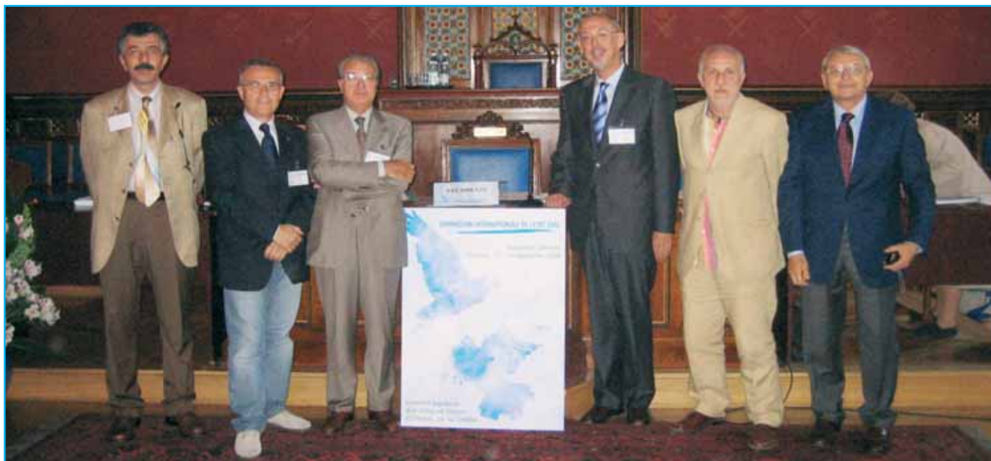
La delegazione della sezione italiana all'Assemblea Generale CIEC a Cracovia