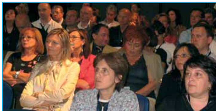
L'attenzione dei numerosi partecipanti ad una iniziativa ANUSCA a EuroPA 2008

Ore 14,30 - La certificazione on line. Guida pratica alla sperimentazione del timbro digitale. - a cura di ANUSCA