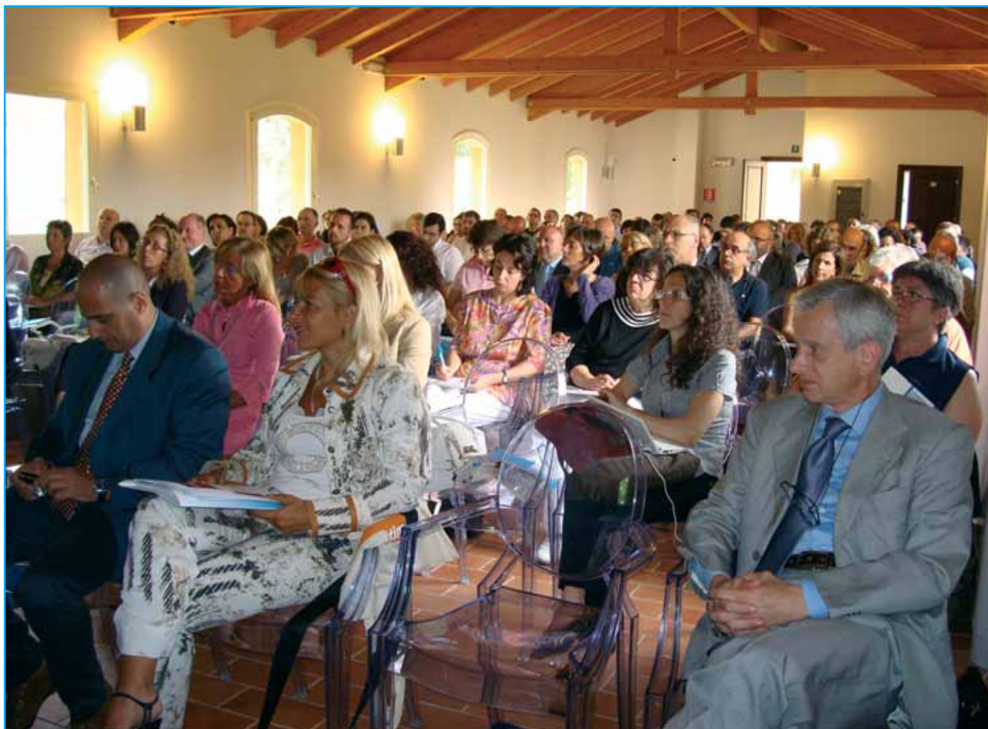
La sala dell'Accademia gremita di partecipanti alla pilota ISTAT sui censimenti

• Si prosegue con il CCNL 2002-2005 che, all'art. 12, prevedeva l'istituzione di una Commissione paritetica "per il sistema di classificazione al fine di promuovere, nell'ambito della vigenza del presente accordo contrattuale, un migliore e più efficace riconoscimento della professiona-