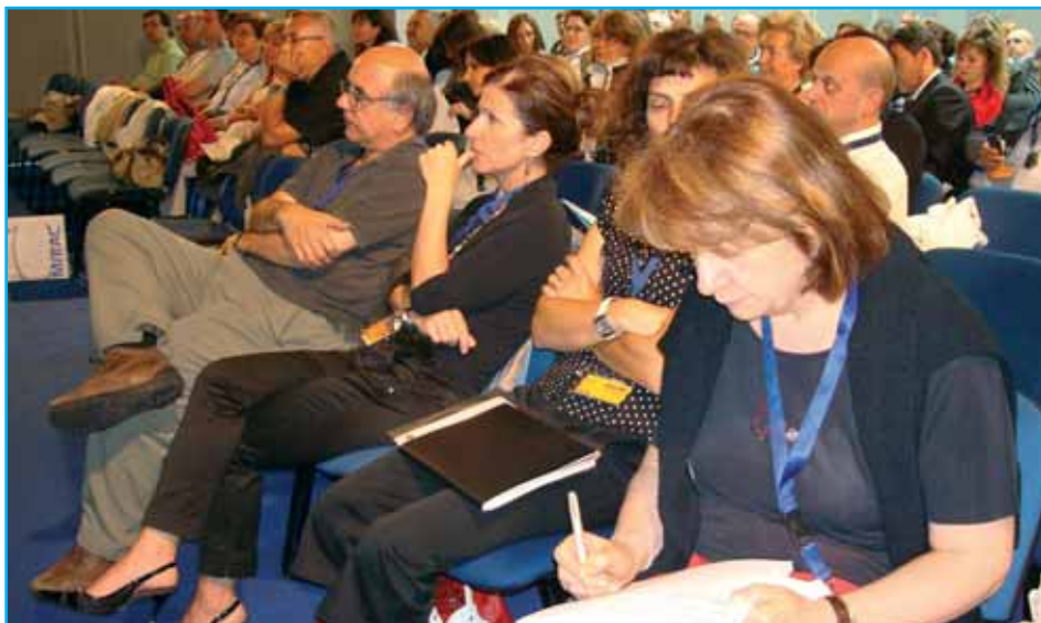
Consiglieri nazionali ad EuroPA 2008

Proposte che l'assemblea può convalidare o meno, nel quadro di un proficuo dibattito che sappia rafforzare gli elementi