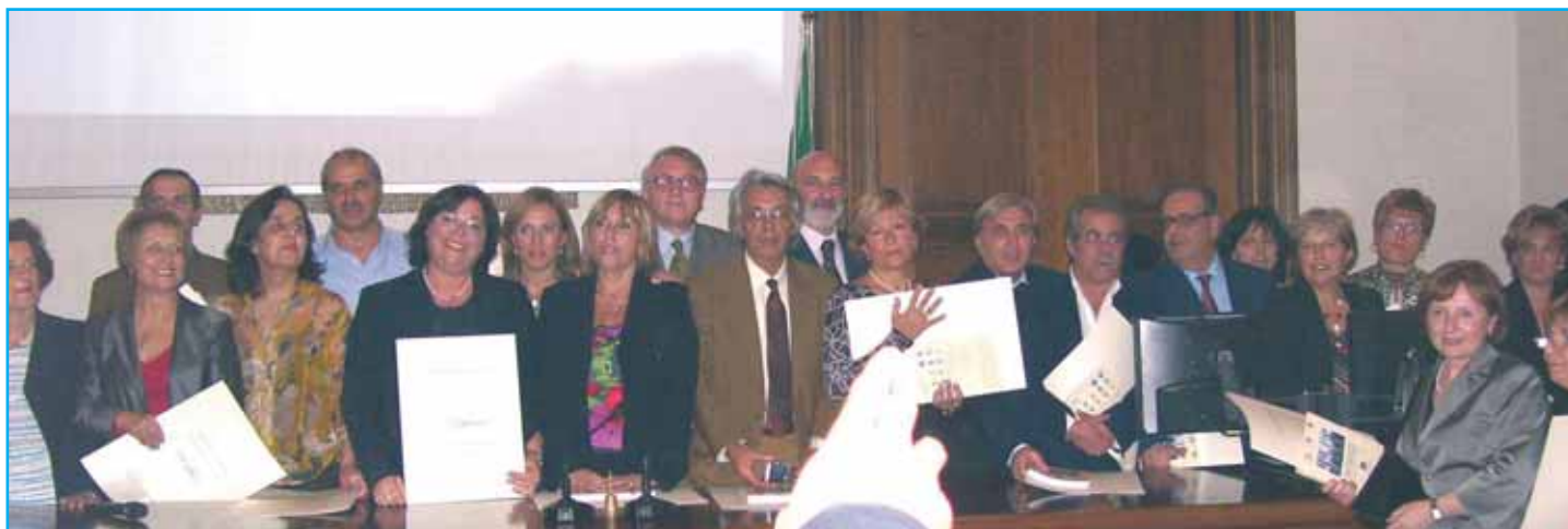
Una bella foto del Corso Abilitazione organizzato dall'Anusca siciliana.

possa rappresentare la meta di un lungo percorso, ma nello stesso tempo l'inizio di un cammino che possa condurre all'obiettivo che tutti gli operatori si aspettano da tempo, e cioè il "riconoscimento" dovuto per coloro i quali hanno dimostrato impegno, professionalità e perché no anche passione, nello svolgere prestazioni di servizio sempre più efficienti, fruibili al cittadino. Non va dimenticato, infine, il ruolo dell'Associazione, continuamente attenta ai problemi e alle richieste degli operatori e da sempre portavoce presso le Istituzioni".