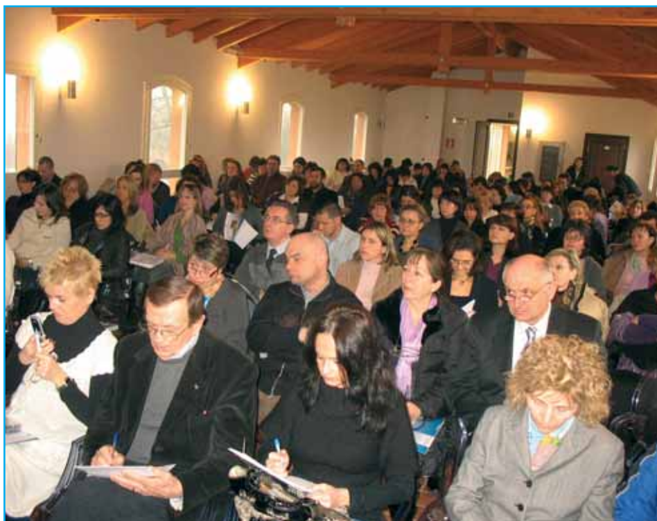
I partecipanti al seminario di studio sull'elettorale

Un milione di cittadini comunitari sono un problema per il diritto elettorale attivo e passivo, da amministrare con molta attenzione. Temi complicati attinenti la sfera del diritto che l'operatore ha il compito di gestire, tenendo conto del tipo di elezione, poiché questi diversi appuntamenti elettorali (comunali, nazionali, europee) sono regolati in maniera differenziata. Gli adempimenti comunali sono legati a tempi stretti, ma la cosa non deve spaventare: è necessario applicare con calma e metodo le indicazioni operative. "Poi – assicura il Prefetto Guglielman – c'è il servizio elettorale del Ministero disponibile a soccorrere chi è in difficoltà".