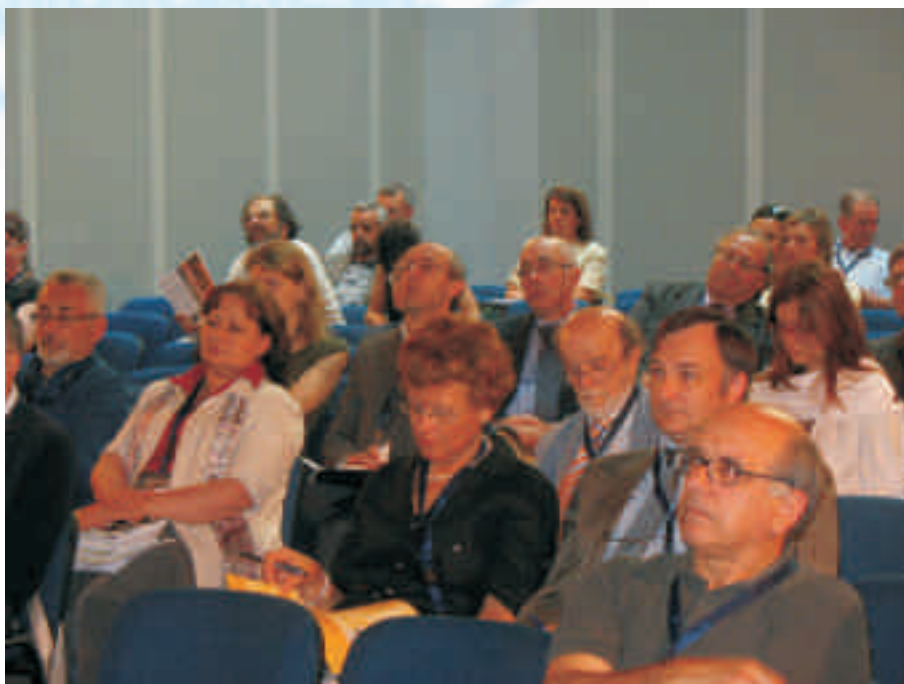
Operatori demografici impegnati da ANUSCA nei corsi di formazione

Verso questo mondo operoso va tutta la nostra solidarietà ed il nostro incessante impegno di valorizzazione professionale; contemporaneamente sollecitiamo Governo, ANCI e Sindacato, affinché verso i dimenticati operatori dei servizi demografici siano assunte decisioni che riconoscano a questa categoria del pubblico impiego un giusto inquadramento che lo liberi dal ruolo di Cenerentola degli uffici comunali.