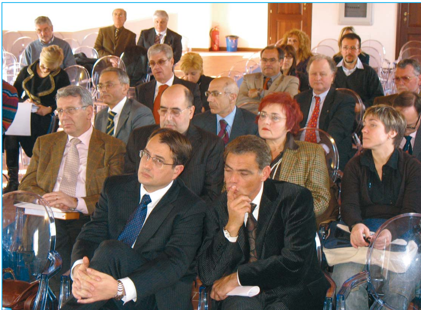
Riunione degli esperti ANUSCA, in Accademia a Castel San Pietro Terme, molti dei quali collaborano con l'Ufficio Stampa ed anche per la realizzazione della Newsletter ANUSCA

Un consiglio? Mettetevi in regola con il versamento della quota d'adesione 2008 all'associazione, che tra i tanti vantaggi, dà diritto a ricevere la Newsletter ANUSCA ogni quindici giorni.