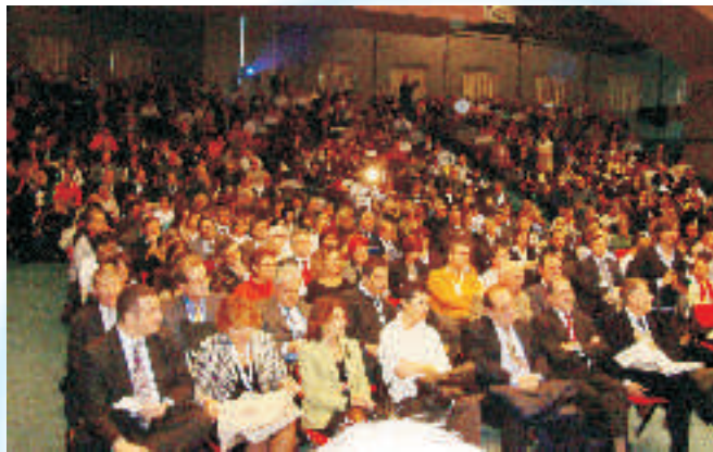
Salsomaggiore 2007.

Da ultimo, ma non trascurabile, è il riconoscimento e la visibilità che presenze come quella del Ministro On. Roberto Maroni e di tanti pubblici amministratori assicurano al lavoro della nostra Associazione.