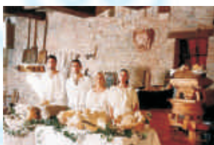
Mulino della Porta di Sotto

"Formaggio delle Fosse della Porta di Sotto", divenendo testimone di pregiate valenze agroalimentari e gastronomiche.