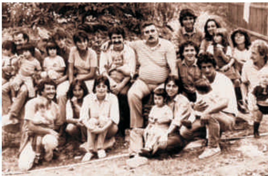
Foto storica con il fondatore della Comunità Vincenzo Muccioli