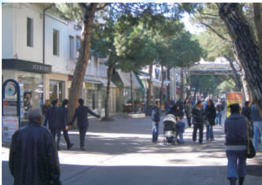
L'accogliente Viale Ceccarini di Riccione

Un suggestivo tuffo nelle atmosfere stile Amarcord nella città natale del Maestro, Borgo San Giuliano, tra le casette dei pescatori della Marina felliniana e i murales dedicati ai film del Maestro