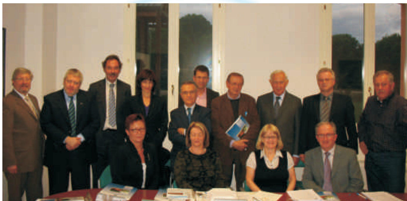
Panoramica sul gruppo dei partecipanti alla riunione dell'EVS svoltasi a Castel San Pietro Terme il 30 e 31 ottobre