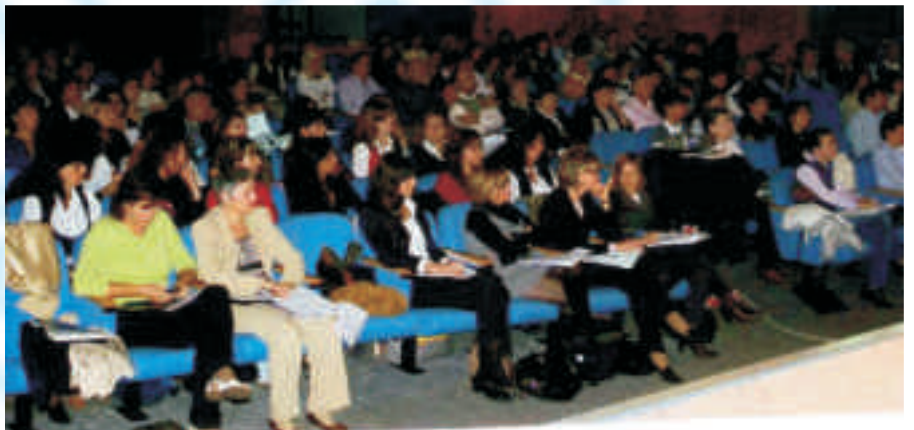
Foto sopra e sotto: particolari che testimoniano la grande partecipazione degli operatori al Convegno regionale Anusca della Lombardia