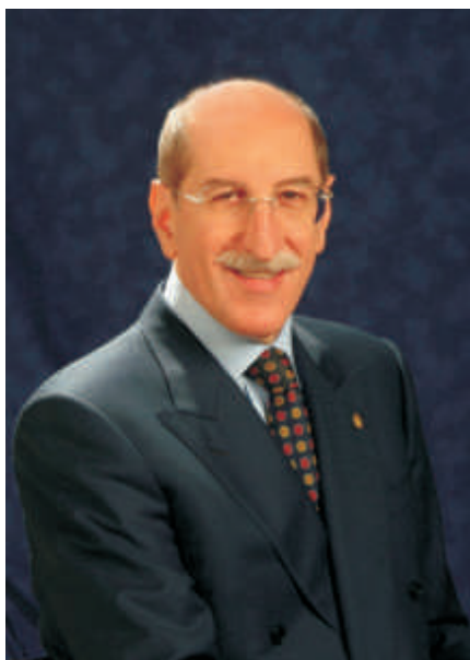
Il Sindaco di Imperia Luigi Sappa

in una professionalità più elevata che sicuramente innalza la qualità dei servizi al cittadino. Un intervento centrato e pertinente, sottolineato dagli applausi sentiti e spontanei dei partecipanti.