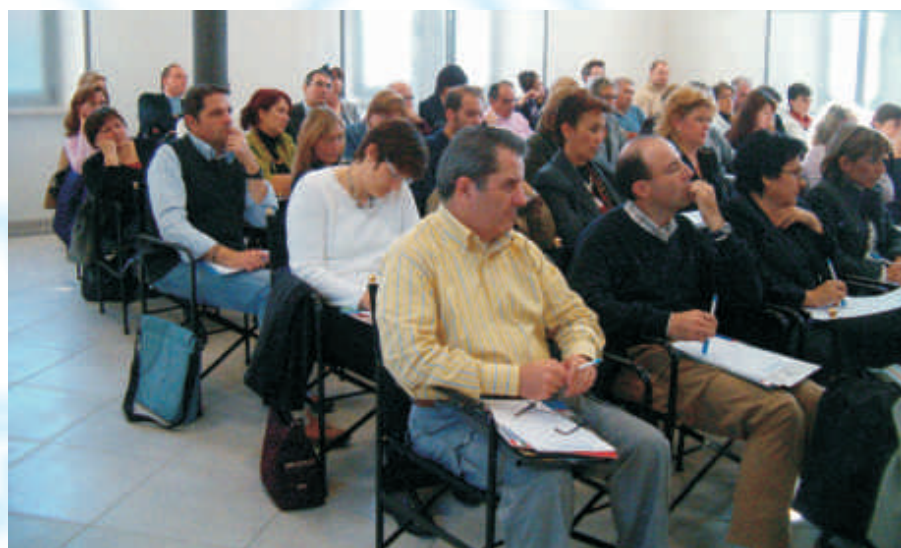
Veduta complessiva dei partecipanti alla giornata di studio