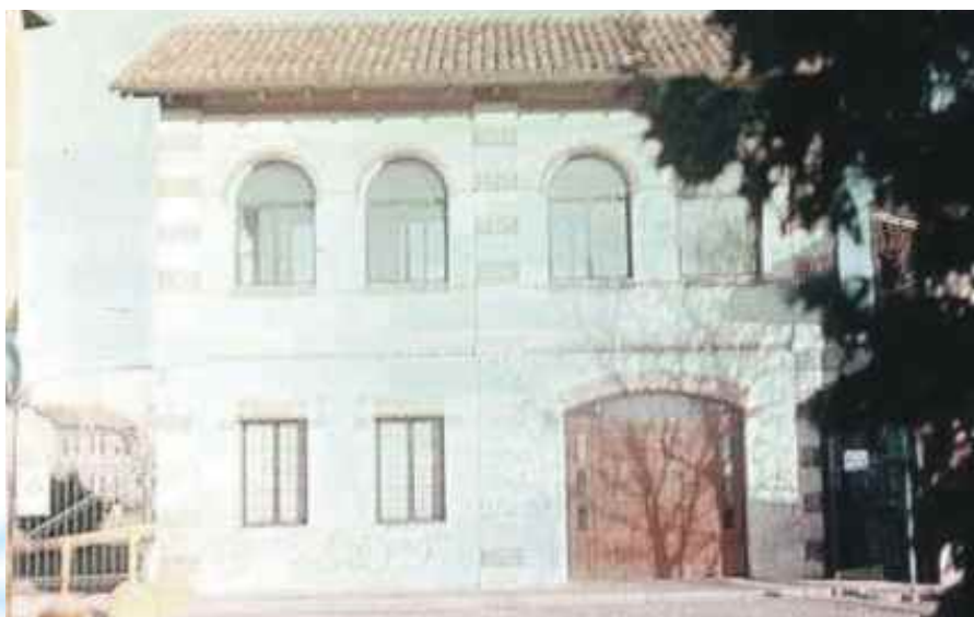
La storica sede dell'anagrafe di Baranzate

E l'opzione associativa non solo è caduta sulla quota B, proprio per fruire dell'aiuto dell'Associazione a 360 gradi, ma si è deciso anche per l'iscrizione individuale di ben 4 dipendenti. Una dimostrazione di sostegno iniezione di entusiasmo e