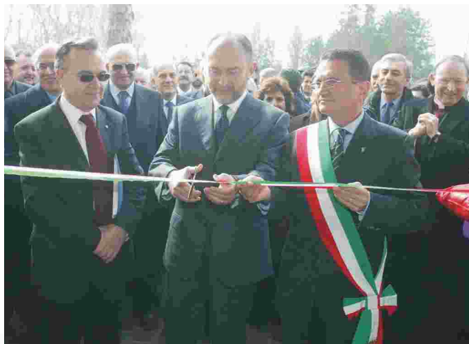
9 marzo 2004: una data storica per l'associazione che ha inaugurato l'Accademia alla presenza del Sottosegretario all'Interno sen. Antonio D'Alì con l'ex sindaco Prantoni e il presidente Gullini.

"Il 24° Convegno Nazionale svoltosi a Bellaria-Igea Marina dal 5 all'8 ottobre 2004 ha registrato un successo superiore ad ogni aspettativa, tenuto anche conto delle difficoltà di bilancio dei Comuni, con 1.415 partecipanti ed oltre 5.500 giornate/presenza complessive. Ma siamo orgogliosi soprattutto per i contenuti ed il dibattito che hanno reso la nostra manifestazione sempre più viva ed appassionante per