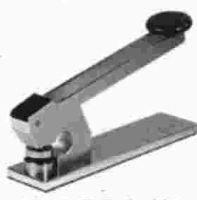
Mod. T.E.S. 101

Timbratrici a secco da tavolo elettriche e manuali