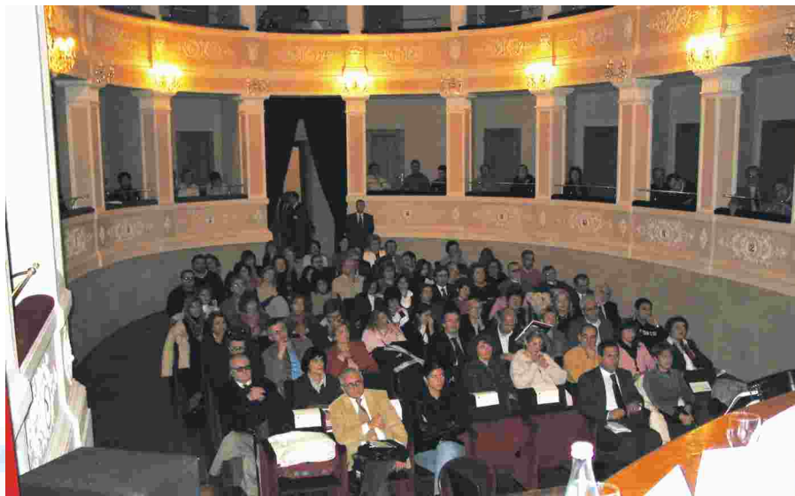
I partecipanti al convegno di Montelupone con operatori di Ancona, Ascoli Piceno, Pesaro, Urbino e Macerata che hanno promosso l'iniziativa.

La grande partecipazione degli operatori dei servizi demografici delle quattro province marchigiane testimonia l'impegno e la profonda consapevolezza che il miglioramento degli stan-