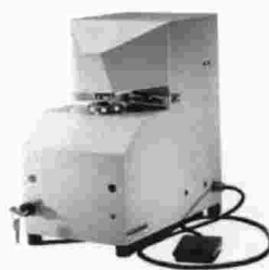
Mod. T.M.S. 202