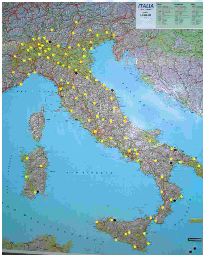
Comitati Regionali (gialli) e Provinciali (blu) ANUSCA.

Un'idea sicuramente brillante quella degli Amministratori di Mira, che, tra l'altro, hanno espresso vivo apprezzamento per il supporto fornito dall'Associazione, e per questo, quindi, un valido esempio che dovrebbe trovare un seguito anche in altri Comuni. Infine, il 2004 ha visto svolgersi di ben 6 convegni Regionali, tutti di grande successo per numeri e partecipazione: in ordine cronologico, il già citato Altomonte (Calabria), quello dell'Emilia Romagna a Parma, Sardegna (Oristano), Friuli (Udine), Lombardia (Lodi) ed infine il recente Convegno delle Marche svoltosi a Montelupone.