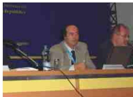
Giovanni De Costanzo

"Con questa iniziativa - spiega De Costanzo - il Ministero e le Regioni attivano un significativo strumento per la condivisione di informazioni e di banche dati, su cui si baseranno i futuri sistemi di e-government per la verifica dell'autenticità dei dati contenuti negli strumenti di autenticazione persona-