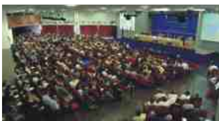
Sala Plenaria durante il 24° Convegno Nazionale di Bellaria

Alla luce dei tanti Convegni nazionali cui ho partecipato, mi aspetto che l'assise di Merano sia propizia per valorizzare ade-