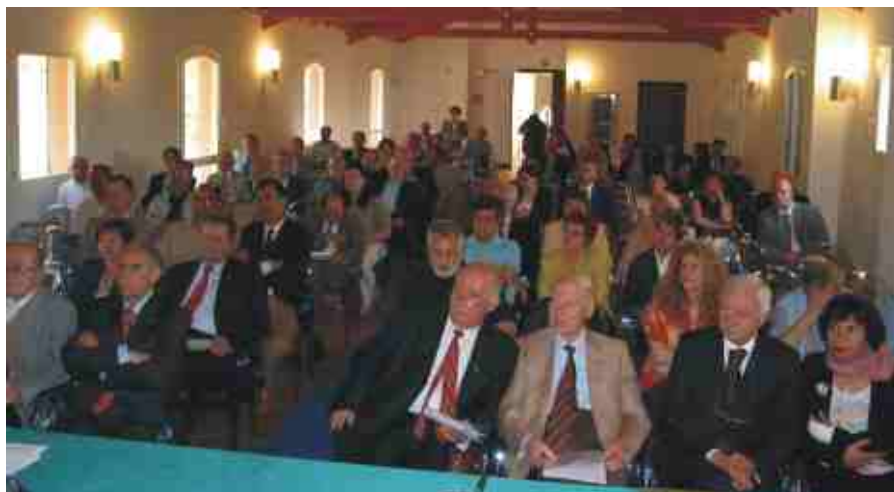
Sala Congressi dell'Accademia per gli Ufficiali di Stato Civile

Se questo master rappresenta un'opportunità formativa interessante per i neolaureati, sarà ancora più appetibile per i funzionari dei Servizi Demografici, che si trovano a gestire con passione e non senza sacrifici un servizio complesso e variegato, spesso penalizzato dalla scarsità delle risorse, ma che presuppone oltre ad una solida preparazione giuridica anche rilevanti