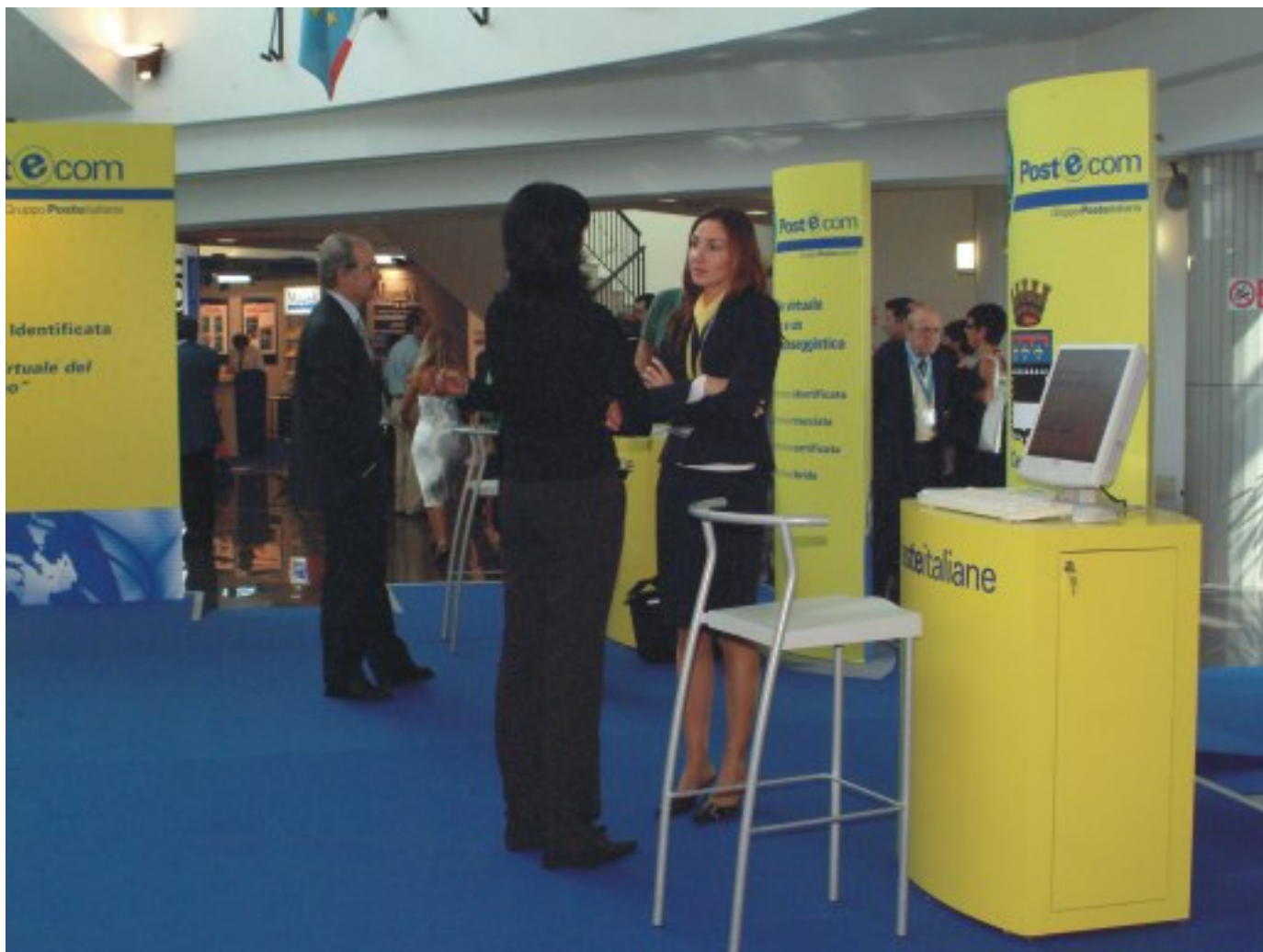
Lo stand Postecom al Convegno nazionale Anusca di Bellaria 2004

il nuovo codice della amministrazione digitale, ci immaginiamo che questo nuovo strumento normativo rappresenti un passo importante per una crescita all'utilizzo degli strumenti informatici evoluti quali le firme digitali o la posta elettronica certificata.