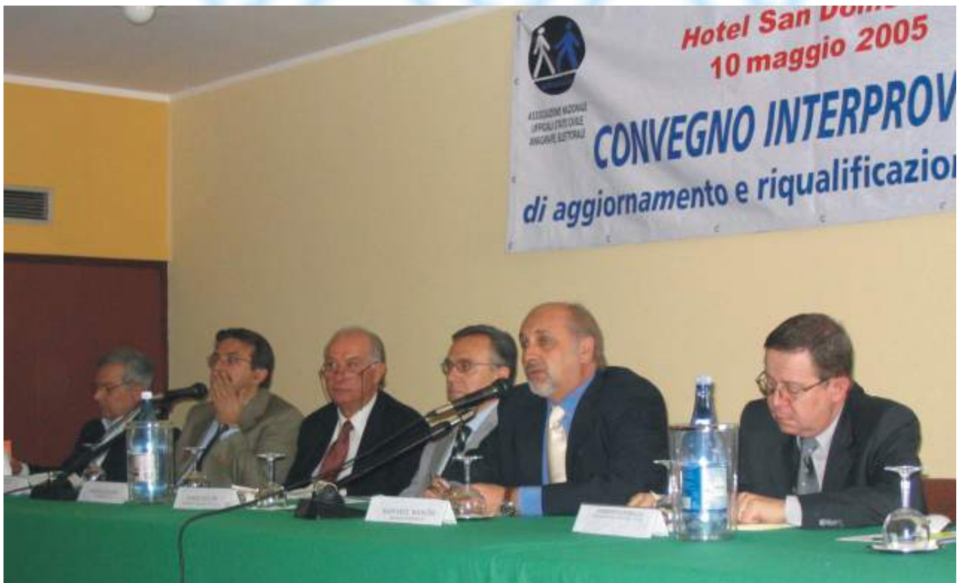
Il tavolo della presidenza del Convegno Interprovinciale Anusca di Soverato