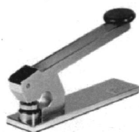
Mod. T.E.S. 101

Timbratrici a secco da tavolo elettriche e manuali