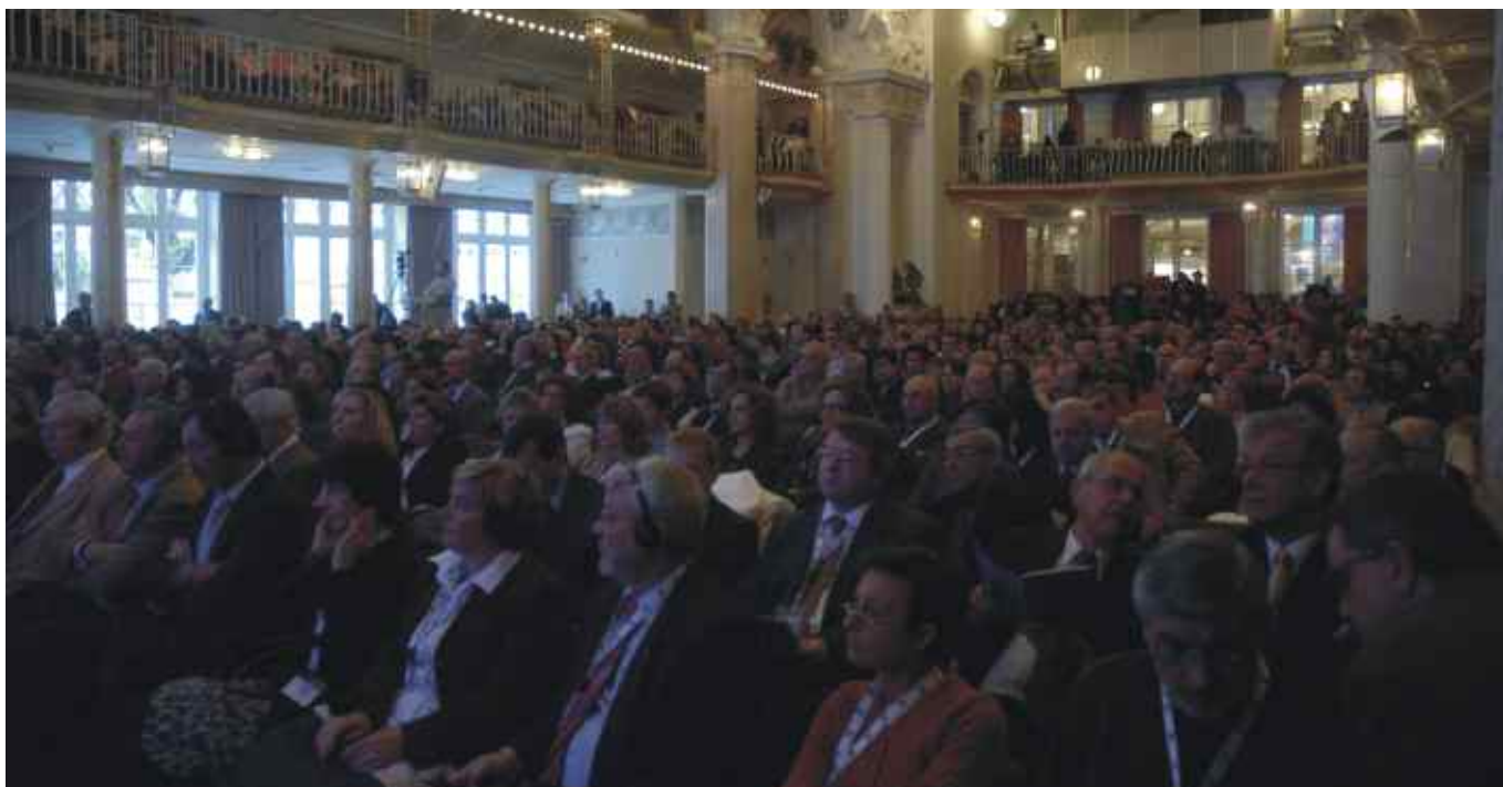
Ancora una immagine della Sala Plenaria del Kurhaus con in prima fila le delegazioni straniere giunte a Merano per il Convegno e per una speciale riunione dell'EVS, l'Associazione Europea di Stato Civile, incaricata di organizzare il Congresso internazionale che si terrà ad Engelberg nella Svizzera centrale