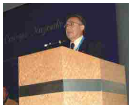
La relazione del Presidente ANUSCA Paride Gullini

Avremo modo di tornare sui momenti più significativi della manifestazione. Intanto esprimiamo la piena soddisfazione per un risultato che va oltre le aspettative, frutto della passione di tanti e della collaborazione competente e specifica della Direzione