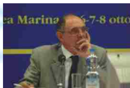
Il Prefetto Ciclosi, coordinatore delle prime due giornate del 24° Congresso Nazionale ANUSCA.

Centrale dei Servizi Demografici, che, in sinergia con ANUSCA, ha contribuito a fare del Convegno un grande evento e che ha registrato alla sua conclusione l'intervento del Sottosegretario all'Interno, Sen. Antonio D'Alì, davanti a una platea affollatissima che gli ha tributato un caloroso e sentito applauso.