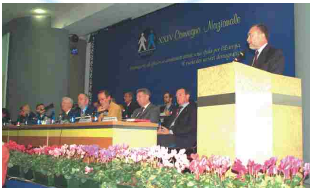
L'intervento del sottosegretario D'Alì alla giornata conclusiva (8 Ottobre)

Centrale dei Servizi Demografici, che, in sinergia con ANUSCA, ha contribuito a fare del Convegno un grande evento e che ha registrato alla sua conclusione l'intervento del Sottosegretario all'Interno, Sen. Antonio D'Alì, davanti a una platea affollatissima che gli ha tributato un caloroso e sentito applauso.