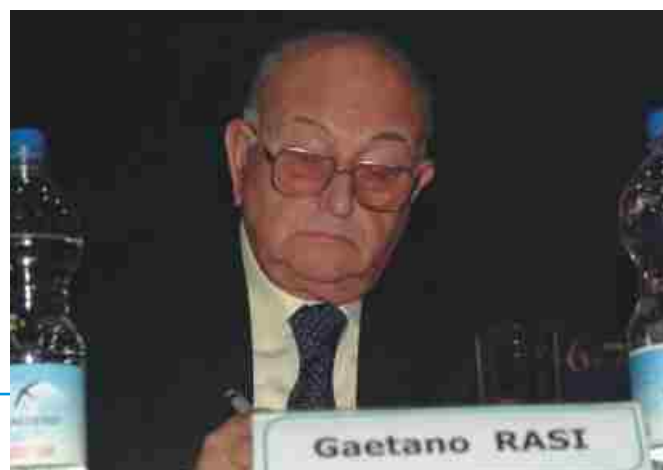
L'Onorevole Gaetano Rasi, garante della Privacy