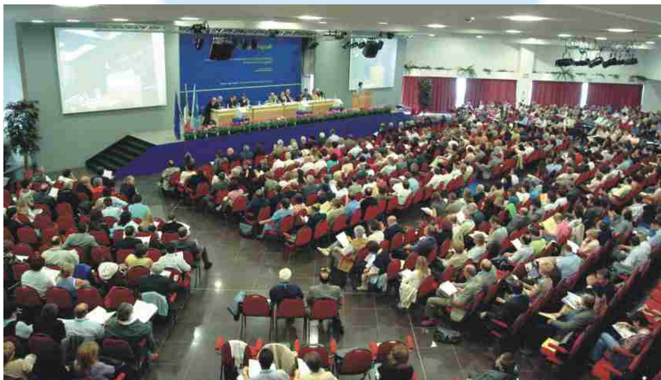
La sala plenaria del Centro Congressi Europeo di Bellaria nel corso della giornata inaugurale (5 ottobre)