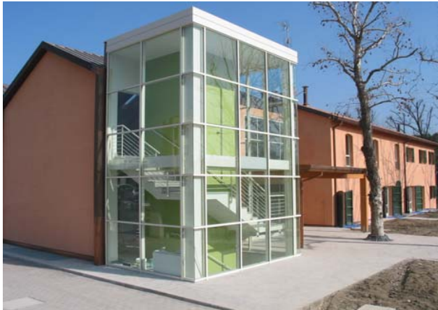
Accademia degli Ufficiali di Stato Civile Anagrafe e Elettorale