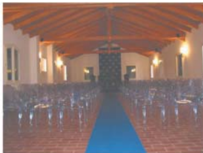
La Sala Congressi dell'Accademia per gli Ufficiali di Stato Civile, Anagrafe ed Elettorale di Castel San Pietro Terme