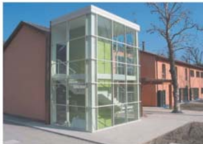
La sede dell'Accademia per gli Ufficiali di Stato Civile, Anagrafe ed Elettorale di Castel San Pietro Terme

Autostrada A14 Bologna-Taranto uscita casello Rimini Nord (circa Km 5 da Bellaria-Igea Marina).